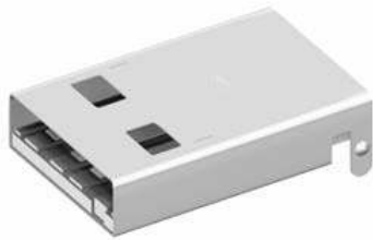
USB A, Stecker