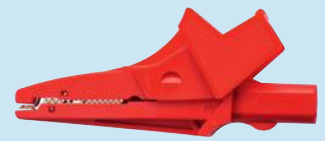
SAK 6674 /..(Farbe) SAK 6674 /..(colour)

test equipment kit Ø 4 mm-safety-system for highest requirements to measuring instruments and integrated application of quick-release-terminals