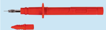
SPS 2381 Ni /..(Farbe) SPS 2381 Ni /..(colour)