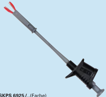
SKPS 6925 / ..(Farbe) SKPS 6925 / ..(colour)