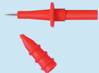
SPS 2590 / ..(Farbe) SPS 2590 / ..(colour)